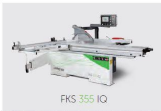
FKS 355 IQ