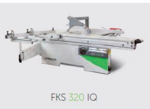
FKS 320 IQ